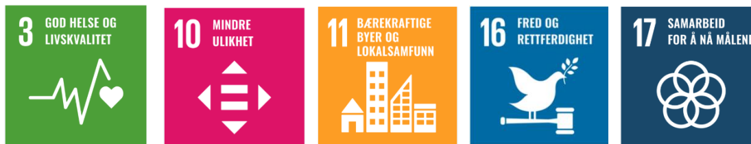
Figur 1 Dei av FNs berekraftsmål som hovudmåla i planen er tufta på.

Kapittelet Fysisk aktivitet, idrett og friluftsliv hentar mål og strategiar frå kommunen sin samfunnsplan. Grunnleggjande for alle måla er FNs berekraftsmål. Dei fire berekraftsmåla som hovudmåla i plan for fysisk aktivitet, idrett og friluftsliv er bygd på er vist i Figur 1.